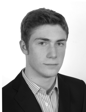
opracował Aleksander Libera

Objęcie przez nasz kraj przewodnictwa w Radzie Unii Europejskiej to nie tylko duże przedsięwzięcie wymagające koordynacji na poziomie ministerialnym, ale również niepowtarzalna okazja do promocji Polski na arenie międzynarodowej. Nie da się ukryć, że Prezydencja daje realną szansę na kształtowanie wspólnotowej polityki. Będziemy przedstawiać na forum europejskim nasze pomysły, inicjatywy i projekty. Mimo światowych zaburzeń musimy zrobić wszystko, aby pokazać, że jesteśmy centrum Europy nie tylko pod względem geograficznym. Jestem przekonany, że wykorzystamy ten czas bardzo efektywnie, ponieważ sukces naszej Prezydencji wpłynie korzystnie na wizerunek Polski w świecie.